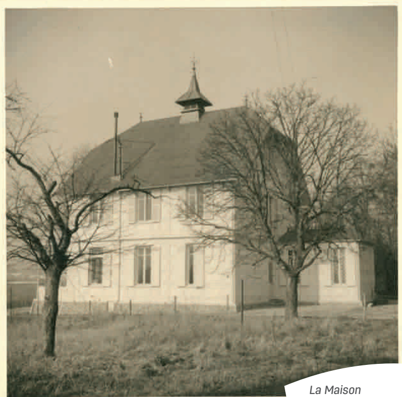
La Maison de Fer va être reconstruite à l'identique.

Souvenir d'une époque florissante, la Maison de Fer, située sur les hauteurs de Poissy, a une place à part dans le patrimoine de la commune. Sa construction sur le plateau de la Maladrerie remonte à 1896.