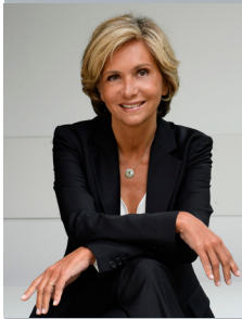
Valérie Péresse, Présidente de la Région Île-de-France, Présidente du STIF