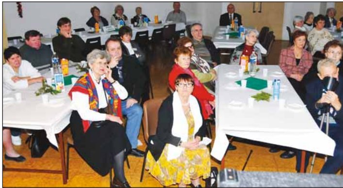
78 personnes étaient présentes au club Péguy, à l'invitation de l'association Saint-Vincent-de-Paul.