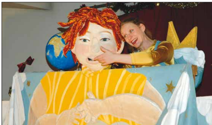
La compagnie Berlingot a présenté aux enfants des clubs de quartier, un spectacle sur l'environnement.

Le mardi 23 décembre, les enfants des clubs de quartiers de Poissy se sont retrouvés au club Péguy pour assister à un spectacle. Chaque année, depuis quatre ans, les enfants inscrits dans les structures de quartiers se retrouvent une après-midi avant Noël pour partager un moment agréable. Au programme pour cette nouvelle édition : "SOS Terre" par la compagnie Berlingot. Un spectacle à la fois original et divertissant sur l'environnement. Pendant une heure, les enfants ont suivi les aventures de Super Nova. Cette drôle de