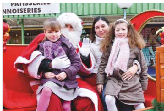
agitation un peu partout. Autre nouveauté proposée par l'UCAP, Pause photo sur la place Racine.

rentes animations. Les enfants furent les premiers heureux grâce à la présence du Père Noël (le vrai !) et ses amis les lutins sur les marchés de la ville : place de la République, place Saint-Exupéry et place Racine. L'occasion pour ces derniers de repartir avec quelques photos souvenirs offertes gracieusement par l'Union du commerce et de l'artisanat (UCAP). Des ambiances festives qui ont engendré une joyeuse