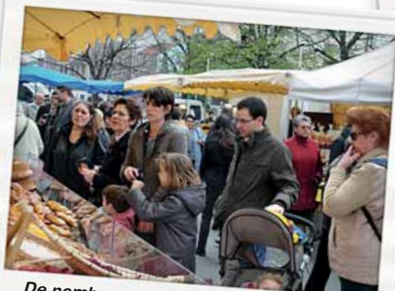
De nombreuses animations commerciales : le marché gastronomique notamment