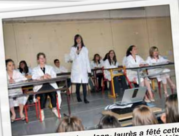
Le collège Jean-Jaurès a fêté cette année 70 ans d'histoire