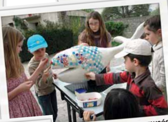
Des ateliers artistiques au musée du Jouet pour les enfants