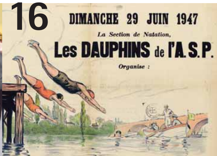
SPORTS LE SPORT PISCIACAI REMONTE LE TEMPS