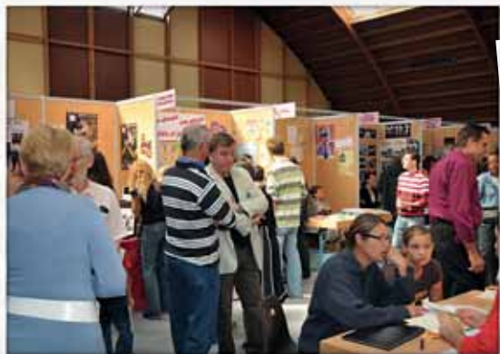
Le Forum des associations est devenu un moment incontournable de la vie pisciacaïse