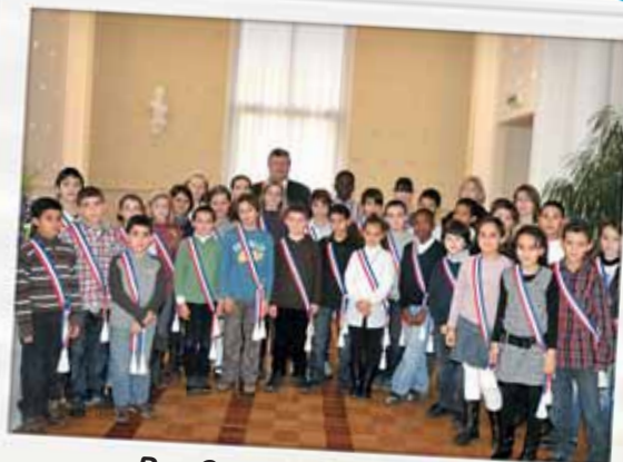
Des Conseillers municipaux enfants découvrent un nouvel univers !