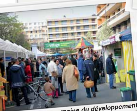
1 re semaine du développement durable à Poissy en avril