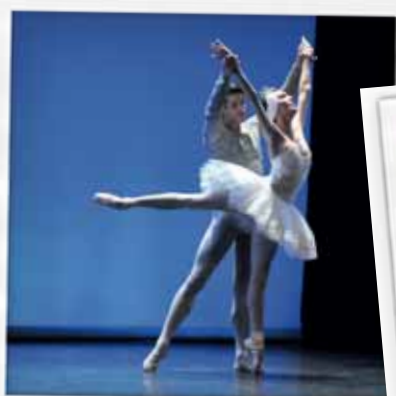
Agnès Letestu danseuse étoile en exclusivité