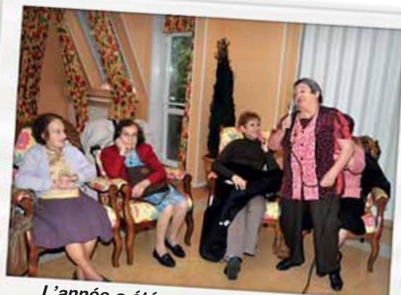
L'année a été marquée par de nombreuses animation pour les aînés, ici "Chantons Ensemble"