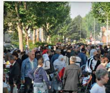
2 e brocante à Beaune