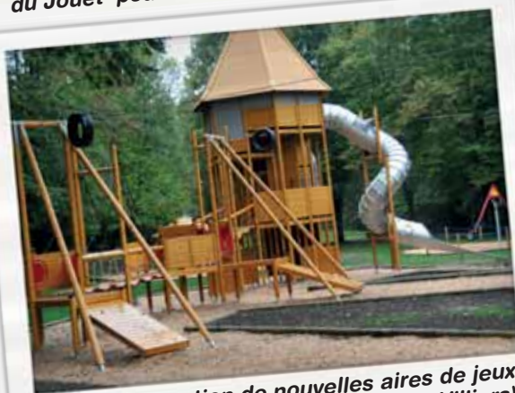
Inauguration de nouvelles aires de jeux pour les enfants (ici au château de Villiers)