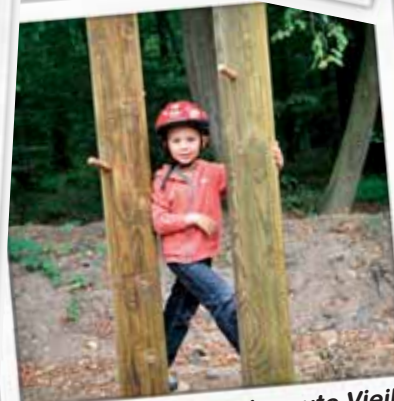
L'aménagement de la route Vieille est réalisé depuis septembre