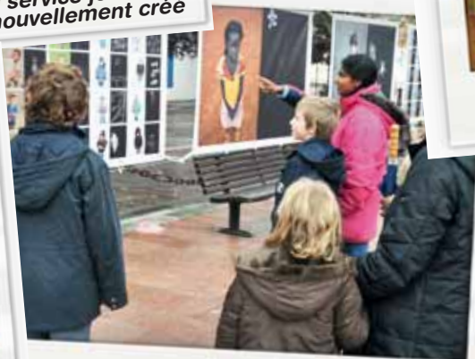
Poissy a fêté les 20 ans de la Convention internationale des droits de l'enfant