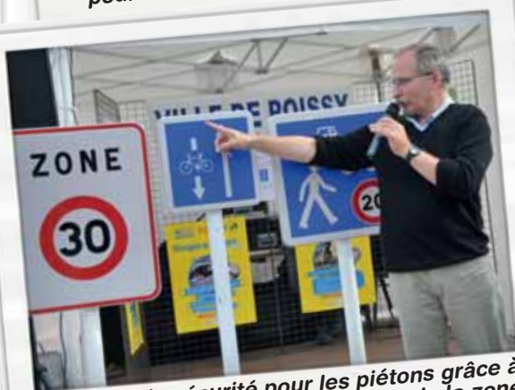
Plus de sécurité pour les piétons grâce à l'inauguration de la zone 30 et de la zone de rencontre en centre-ville