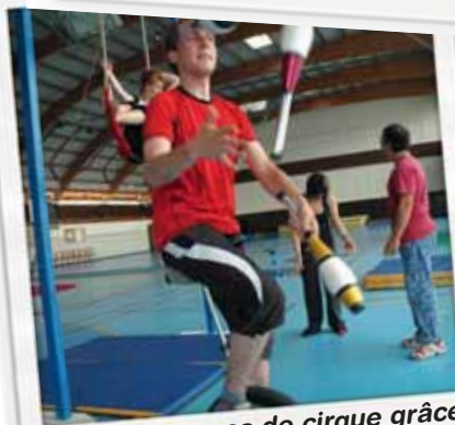
Des stages de cirque grâce au service jeunesse nouvellement créé