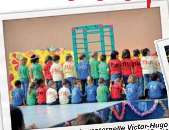
Le 20 juin, l'école maternelle Victor-Hugo est en fête pour célébrer ses 40 ans