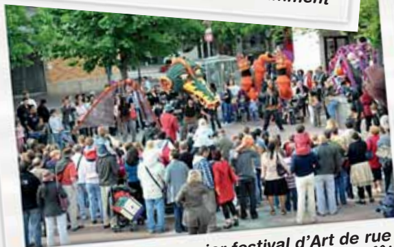
Premier festival d'Art de rue : Poissy en fête