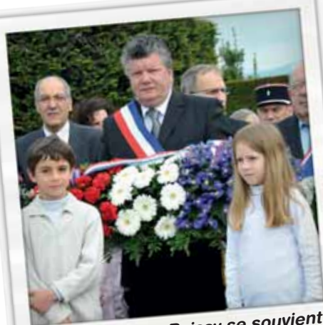
Poissy se souvient comme ici, le 8 mai 1945