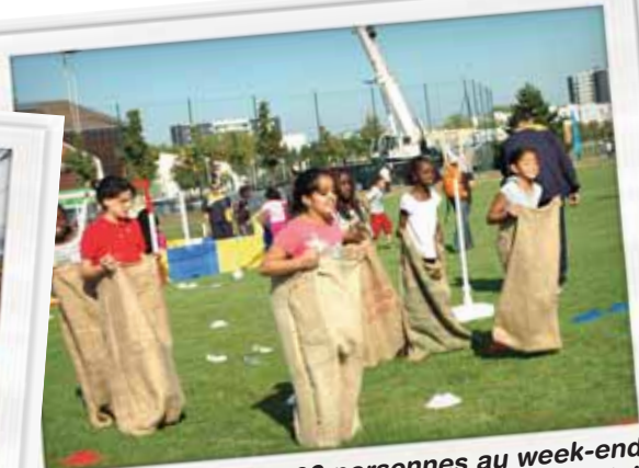
3000 personnes au week-end UFOLEP "sport en famille"