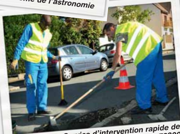
Le Service d'intervention rapide de la Ville à votre service : 08100 78300