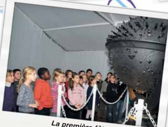
La première fête de la science sur le thème de l'astronomie