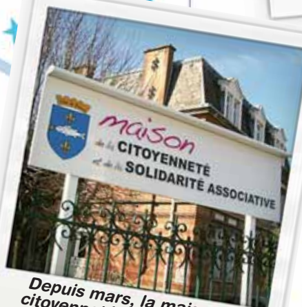
Depuis mars, la maison de la citoyenneté et de la solidarité fonctionne à plein régime