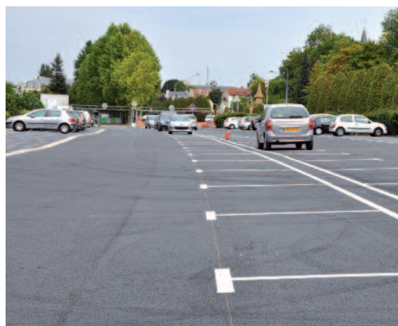
• PARKING MEISSONIER (14, rue du Bon Roi Saint-Louis) Réfection partie ouest (1 ère phase) – 225 000 euros