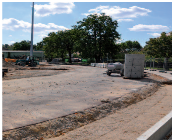
• STADE LÉO-LAGRANGE (8, rue du Stade) Réalisation d'une piste d'athlétisme autour du terrain d'honneur – 860 000 euros