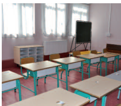
Des locaux totalement rénovés au groupe scolaire Robert-Fournier

À leur retour de vacances, les écoliers de Poissy ont découvert des classes propres et parfois relookées. Pour certains, le changement est total, pour ceux fréquentant l'école Robert-Fournier ou les selfs des groupes scolaires de l'Abbaye et Montaigne, notamment. Les parents, quant à eux, apprécient les nouveaux locaux accueillant le service éducation et loisirs.