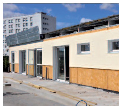
Un bâtiment destiné à la restauration scolaire a été réalisé école Montaigne.