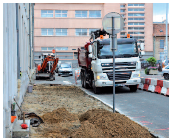
• RUE DU 8 MAI 1945 (entre l'avenue du Cep et la rue de la Libération) Réaménagement du stationnement, reconstruction du trottoir côté impair, création d'un éclairage public et remplacement de la canalisation d'égout – 100 000 euros