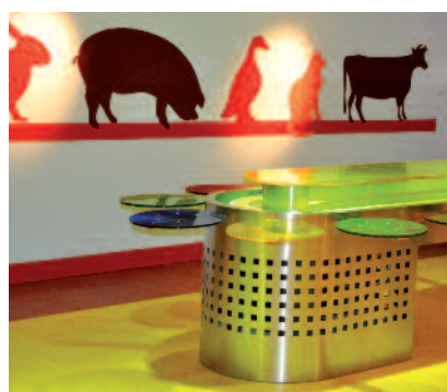
Une salle de restauration relookée pour les élèves de l'élémentaire Abbaye.