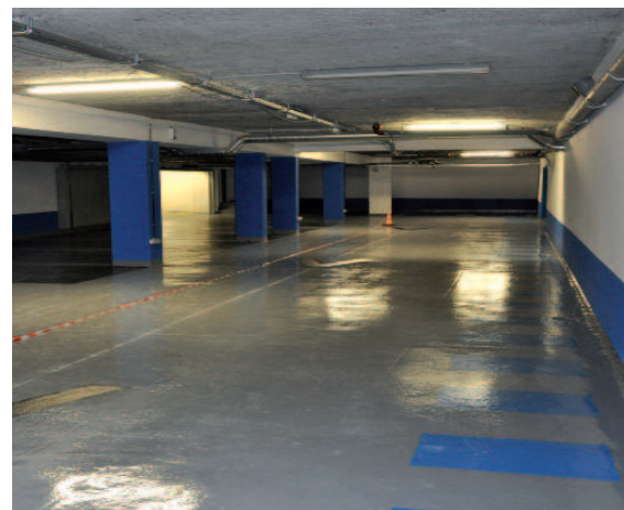
• PARKING SOUTERRAIN DES LYS (97, avenue Maurice-Berteaux) Réhabilitation du parking – 1 200 000 euros