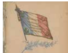
LIBÉRATION DE POISSY SÉRIE 100 ANS 1914-1918