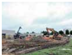
SÉCURITÉ AÎNÉS RÉUNION AUX SABLONS ÉCOLE SAINT-EXUPÉRY