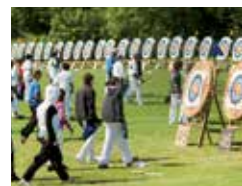
TRIATHLON / ECOLLÈGE FOOT FÉMININ / RUGBY FÉMININ / TIR À L'ARC VOLLEY / 80 ANS BASKET