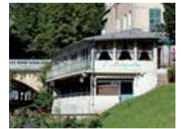
SOCHIFE METALE / LE BOUCANIER / RENAISSANCE SERVICES / L'ESTURGEON / LYSS OPTIQUE / LE VICTOR-HUGO