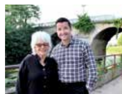
ENTRETIEN AVEC CATHERINE LARA THÉÂTRE : UNE SAISON DE VOYAGE