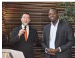
POISSY CRÉATOR : UN COUP DE POUCE À QUATRE CRÉATEURS