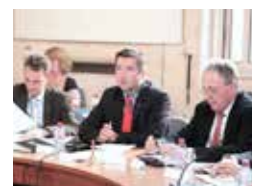
CONSEIL MUNICIPAL PAC : VERS UNE COMMUNAUTÉ D'AGGLOMÉRATION