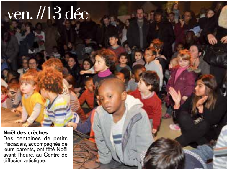
Noël des crèches Des centaines de petits Pisciacais, accompagnés de leurs parents, ont fêté Noël avant l'heure, au Centre de diffusion artistique.