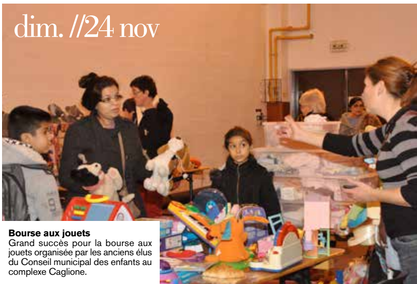
Bourse aux jouets Grand succès pour la bourse aux jouets organisée par les anciens élus du Conseil municipal des enfants au complexe Caglione.