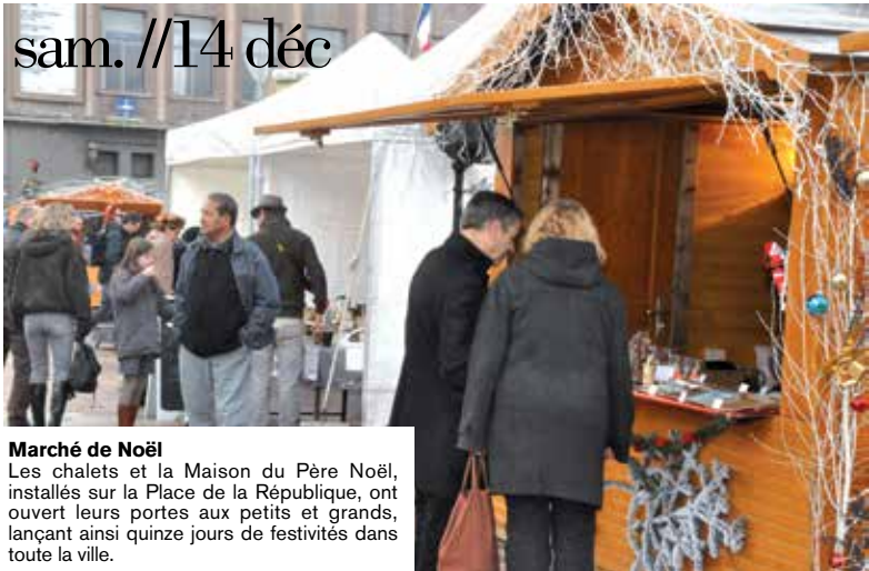
Marché de Noël Les chalets et la Maison du Père Noël, installés sur la Place de la République, ont ouvert leurs portes aux petits et grands, lançant ainsi quinze jours de festivités dans toute la ville.