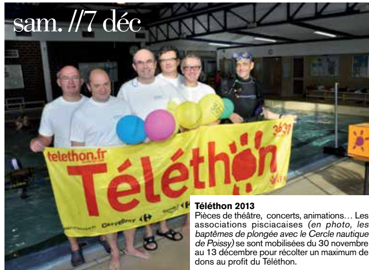
Téléthon 2013 Pièces de théâtre, concerts, animations... Les associations pisciacaises (en photo, les baptêmes de plongée avec le Cercle nautique de Poissy) se sont mobilisées du 30 novembre au 13 décembre pour récolter un maximum de dons au profit du Téléthon.