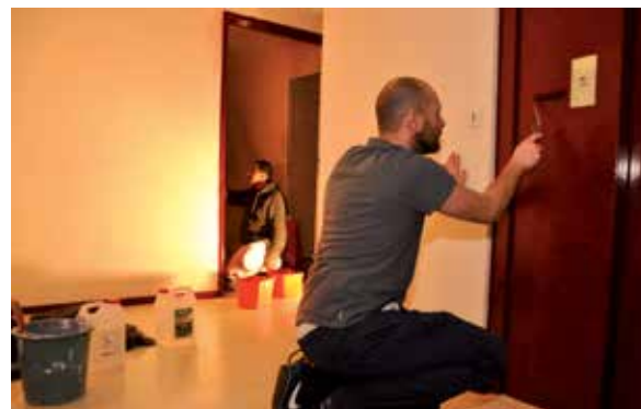
Quatre chantiers d'insertion ont permis aux habitants des résidences 3F de Saint-Exupéry de retrouver un cadre de vie agréable. Cette initiative permet aussi de favoriser la (ré)insertion des salariés concernés.