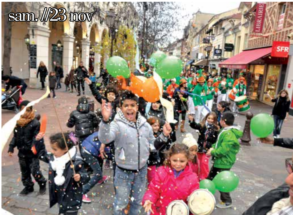
Défilé des Droits de l'enfant Le grand défilé des enfants et des parents des accueils de loisirs, du centre social André-Malraux et du Conseil municipal des enfants a clôturé en beauté la Semaine des Droits de l'Enfant.