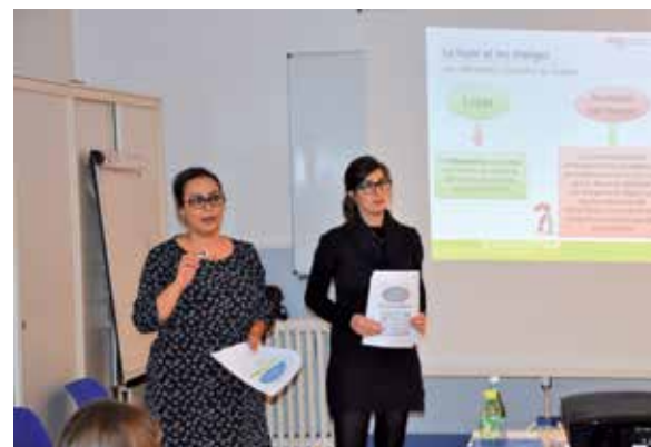
En lien avec l'ARC et l'ADIL, la Ville a lancé en 2013 des formations habitat destinées à informer tous les Pisciacais, qu'ils soient (co)propriétaires ou locataires. L'opération sera reconduite en 2014.

C'est à Poissy le taux de logements collectifs anciens potentiellement énergivores. Un vaste travail d'efficacité énergétique en perspective.