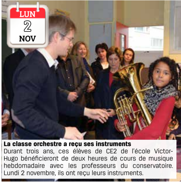
LUN 2 NOV La classe orchestre a reçu ses instruments Durant trois ans, ces élèves de CE2 de l'école Victor-Hugo bénéficieront de deux heures de cours de musique hebdomadaire avec les professeurs du conservatoire. Lundi 2 novembre, ils ont reçu leurs instruments.