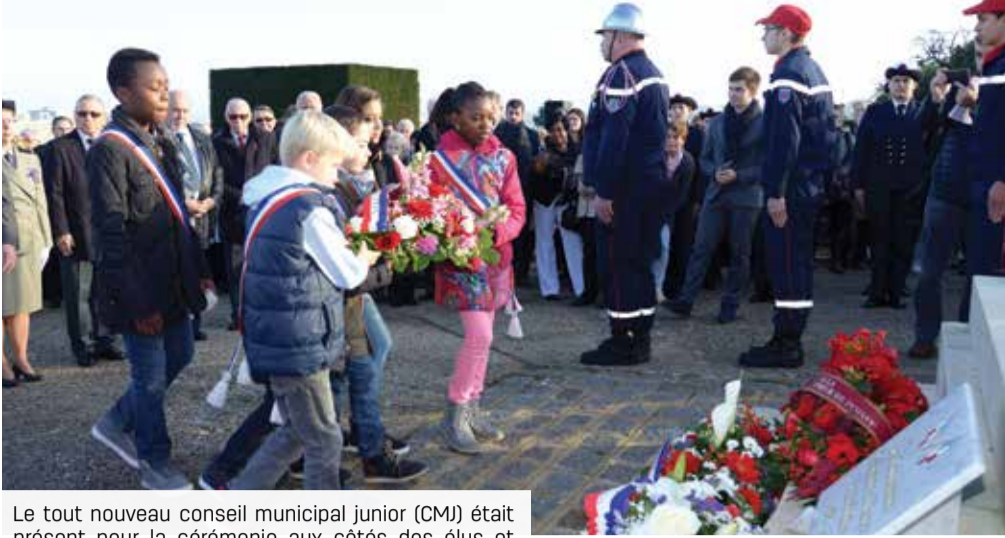
Le tout nouveau conseil municipal junior (CMJ) était présent pour la cérémonie aux côtés des élus et autorités.