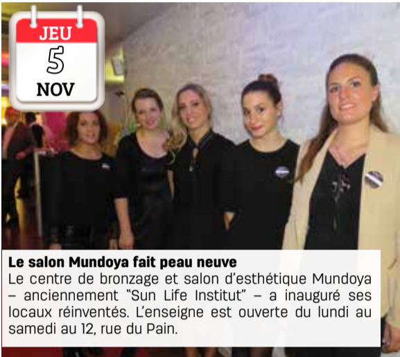
JEU 5 NOV Le salon Mundoya fait peau neuve Le centre de bronzage et salon d'esthétique Mundoya - anciennement "Sun Life Institut" - a inauguré ses locaux réinventés. L'enseigne est ouverte du lundi au samedi au 12, rue du Pain.