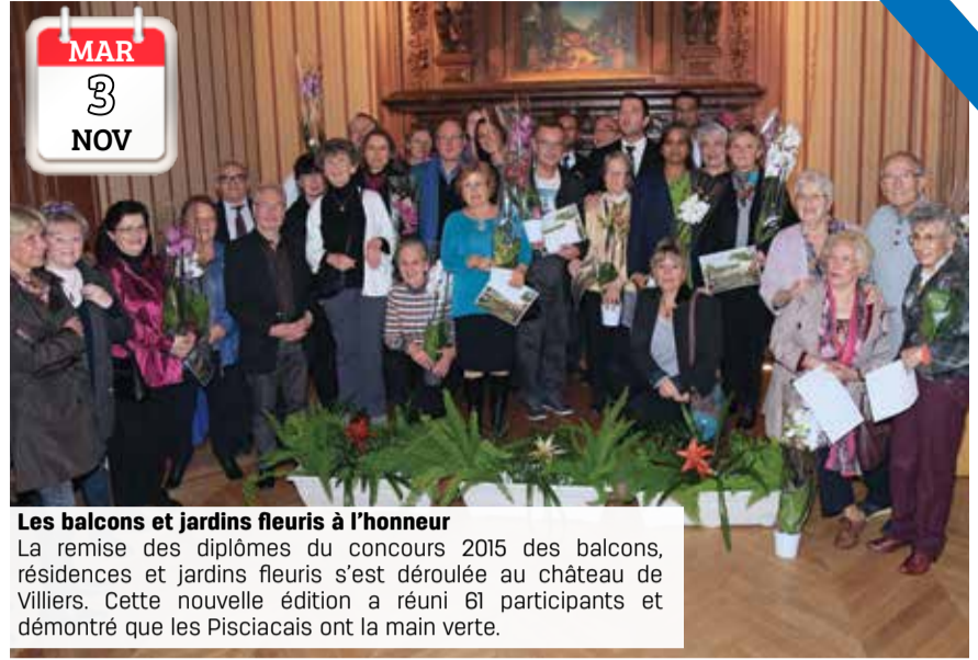
MAR 3 NOV Les balcons et jardins fleuris à l'honneur La remise des diplômes du concours 2015 des balcons, résidences et jardins fleuris s'est déroulée au château de Villiers. Cette nouvelle édition a réuni 61 participants et démontré que les Pisciacais ont la main verte.