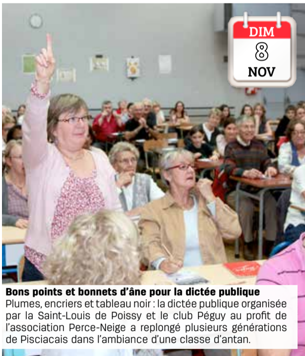
DIM 8 NOV Bons points et bonnets d'âne pour la dictée publique Plumes, encriers et tableau noir : la dictée publique organisée par la Saint-Louis de Poissy et le club Péguy au profit de l'association Perce-Neige a replongé plusieurs générations de Pisciacais dans l'ambiance d'une classe d'antan.