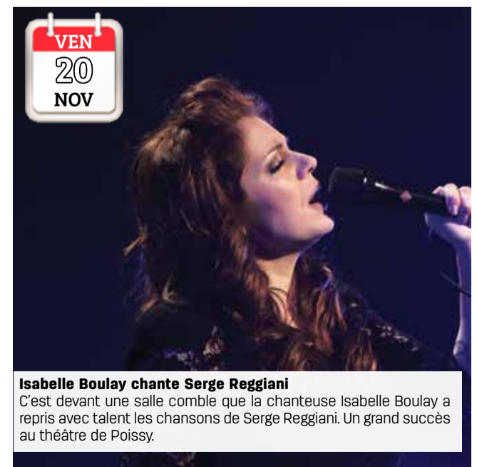
VEN 20 NOV Isabelle Boulay chante Serge Reggiani C'est devant une salle comble que la chanteuse Isabelle Boulay a repris avec talent les chansons de Serge Reggiani. Un grand succès au théâtre de Poissy.