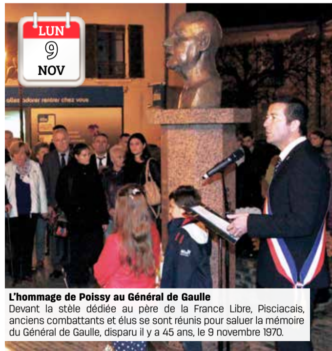
LUN 9 NOV L'hommage de Poissy au Général de Gaulle Devant la stèle dédiée au père de la France Libre, Pisciacais, anciens combattants et élus se sont réunis pour saluer la mémoire du Général de Gaulle, disparu il y a 45 ans, le 9 novembre 1970.