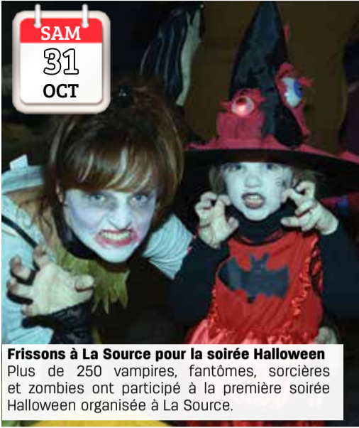
SAM 31 OCT Frissons à La Source pour la soirée Halloween Plus de 250 vampires, fantômes, sorcières et zombies ont participé à la première soirée Halloween organisée à La Source.