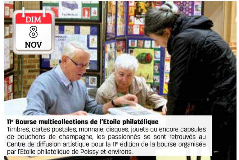
DIM 8 NOV 11 e Bourse multicollections de l'Etoile philatélique Timbres, cartes postales, monnaie, disques, jouets ou encore capsules de bouchons de champagne, les passionnés se sont retrouvés au Centre de diffusion artistique pour la 11 e édition de la bourse organisée par l'Etoile philatélique de Poissy et environs.