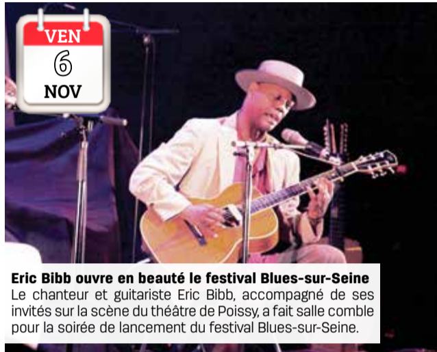
VEN 6 NOV Eric Bibb ouvre en beauté le festival Blues-sur-Seine Le chanteur et guitariste Eric Bibb, accompagné de ses invités sur la scène du théâtre de Poissy, a fait salle comble pour la soirée de lancement du festival Blues-sur-Seine.