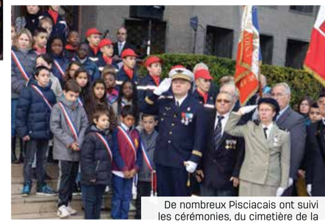
De nombreux Pisciacaïses ont suivi les cérémonies, du cimetière de la Tournelle à la place de la République.

Mercredi 11 novembre, de nombreux Pisciacaïses se sont retrouvés autour du monument aux Morts du cimetière de la Tournelle pour saluer la mémoire des combattants et victimes de la Première Guerre mondiale. Associations patriotiques, sapeurs-pompiers, protection civile, Police nationale et Police municipale mais aussi Marine nationale, ils étaient tous présents en cette journée de commémoration de l'armistice du 11 novembre 1918. Retrouvez toutes les photos de la cérémonie sur www.ville-poissy.fr