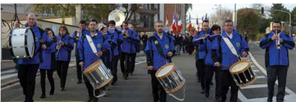
Les associations patriotiques, jeunes pompiers, marins et élus ont défilé dans le centre-ville.