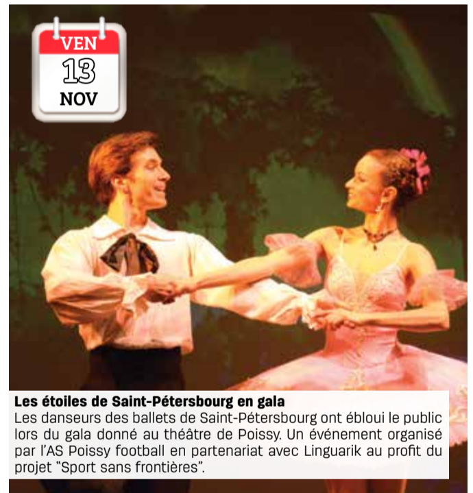
VEN 13 NOV Les étoiles de Saint-Petersbourg en gala Les danseurs des ballets de Saint-Petersbourg ont ébloui le public lors du gala donné au théâtre de Poissy. Un événement organisé par l'AS Poissy football en partenariat avec Linguarik au profit du projet "Sport sans frontières".