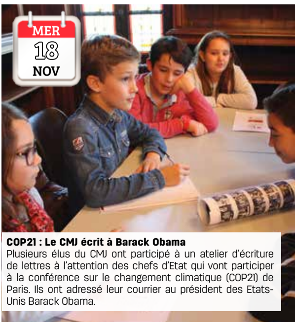
MER 18 NOV COP21 : Le CMJ écrit à Barack Obama Plusieurs élus du CMJ ont participé à un atelier d'écriture de lettres à l'attention des chefs d'Etat qui vont participer à la conférence sur le changement climatique (COP21) de Paris. Ils ont adressé leur courrier au président des Etats-Unis Barack Obama.